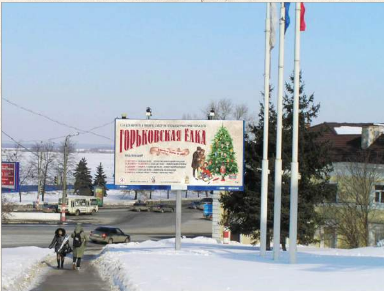
Плакат 6x3 м