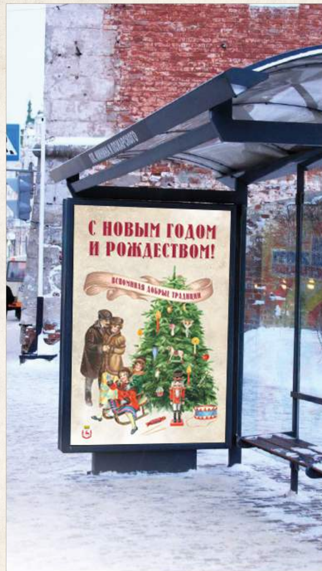
Плакат 1.2 x 1.8 м