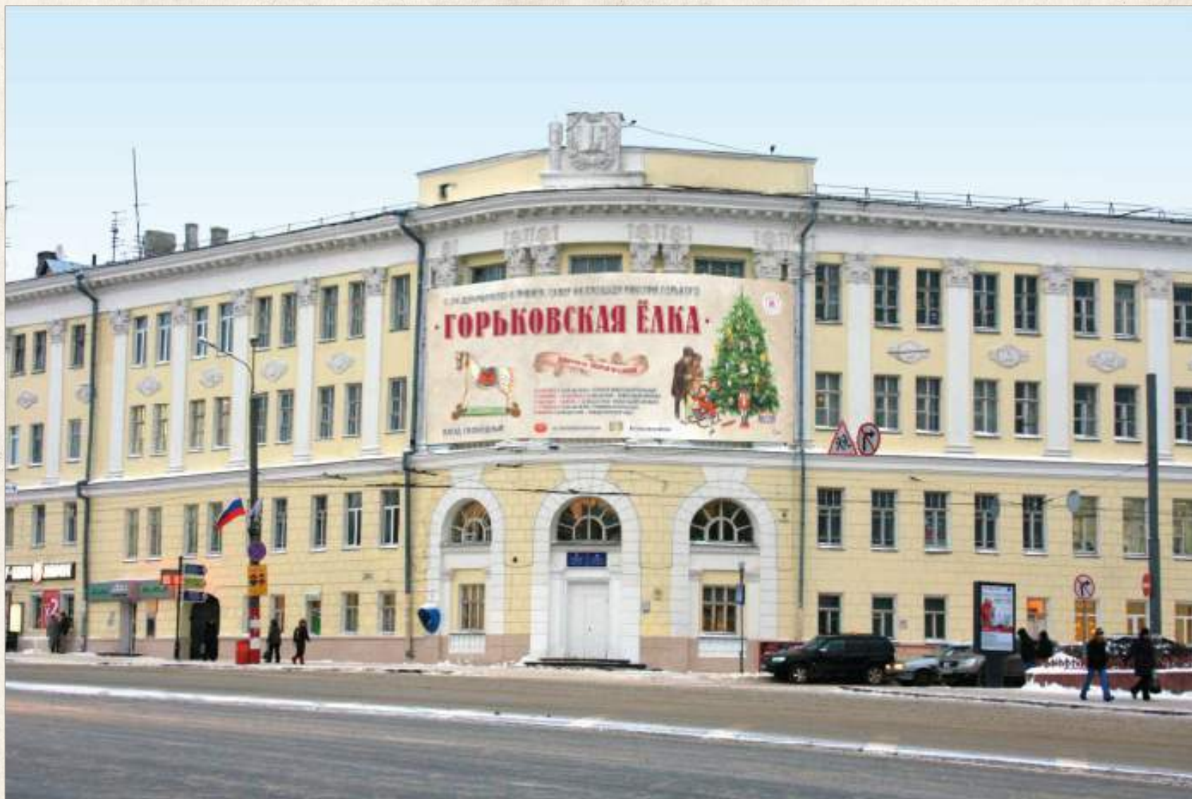
Панно на Гимназии №1