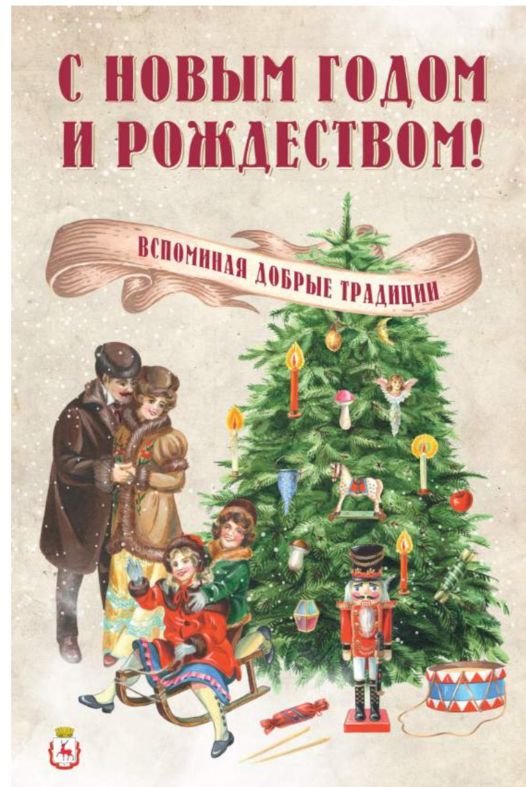
Плакат 1.2 x 1.8 м