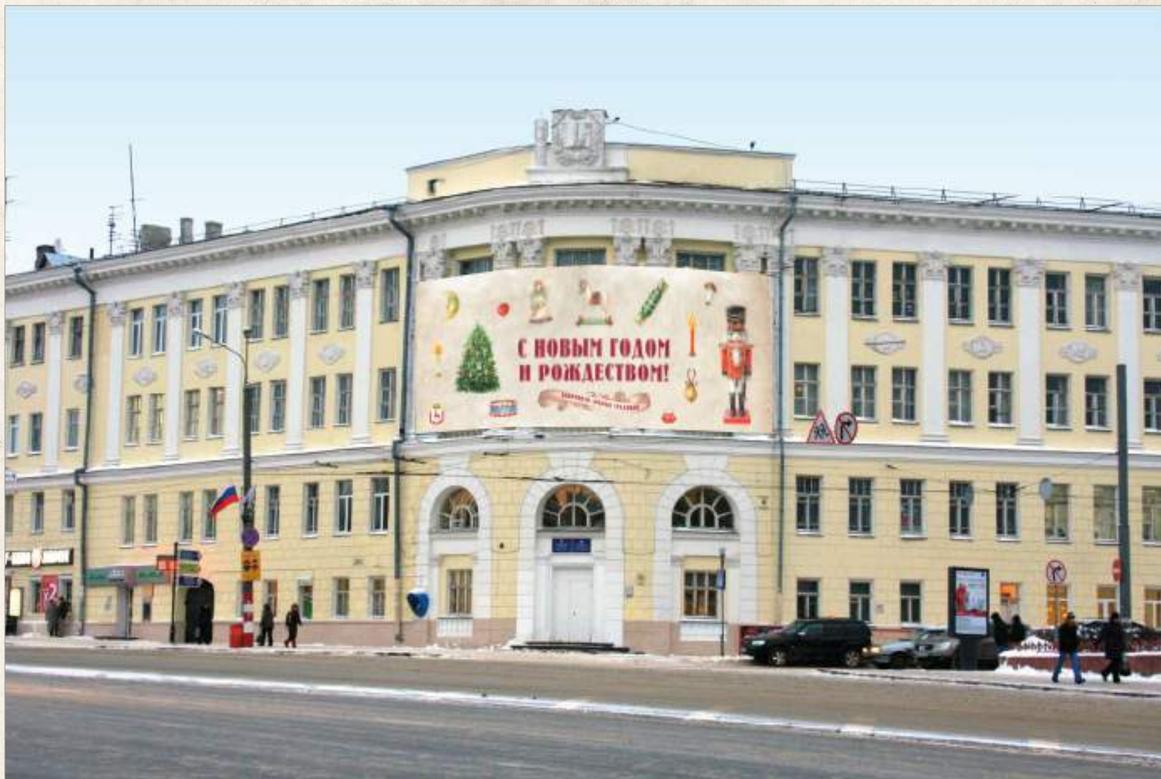
Панно на Гимназии №1