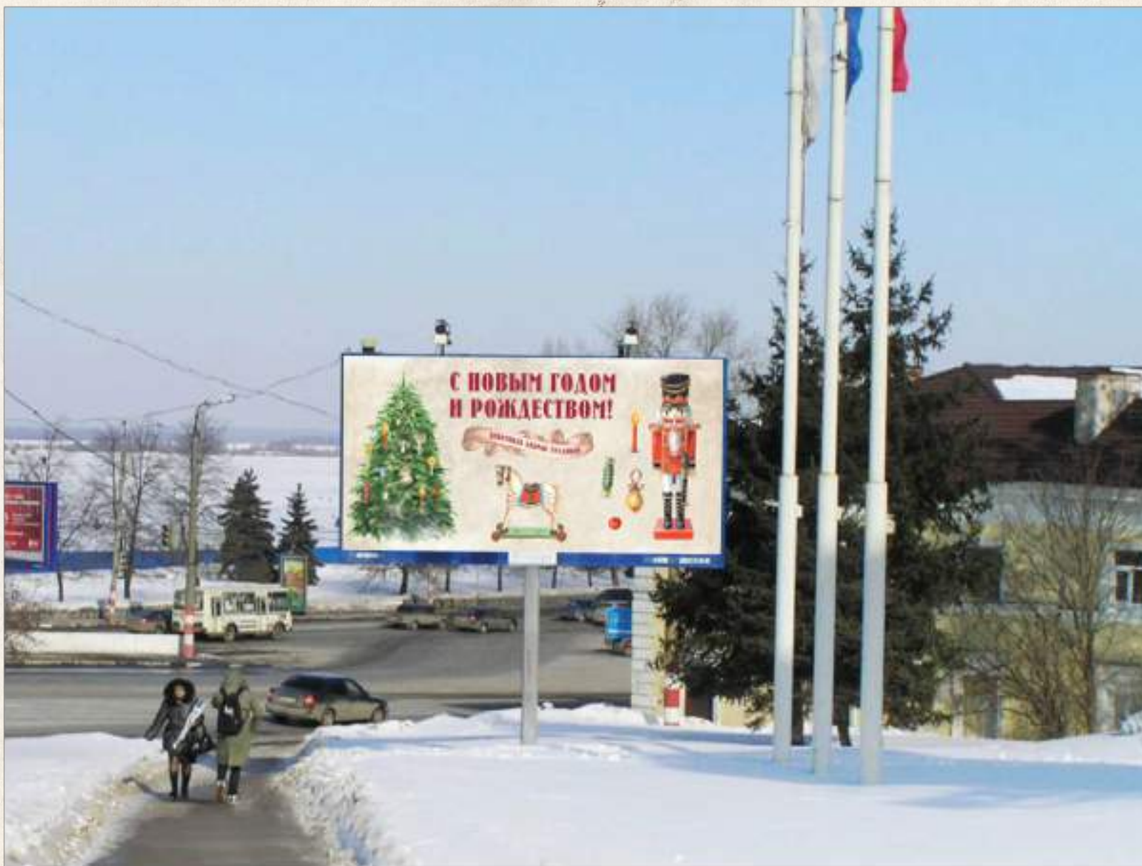
Плакат 6x3 м