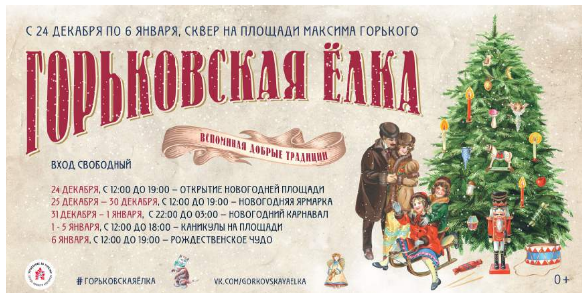
Плакат 6x3 м